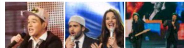
Factor X - 7ª Gala