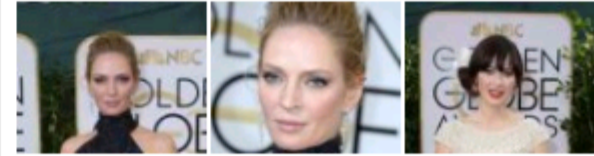
Globos de Ouro 2014 2