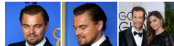
Globos de Ouro 2014 1