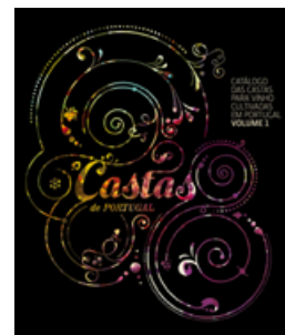
Catálogo das Castas

OIV Organização Internacional da Vinha e do Vinho