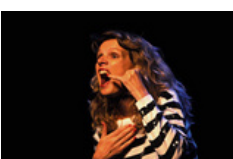
Rir em tempo de crise