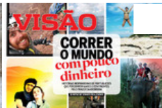
Correr o mundo com pouco dinheiro