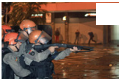
Milhares nas ruas, um morto e tensão ao rubro