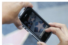
Mulher esfaqueada no Passeio da Fama por não dar dinheiro a pedintes