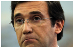
Pagamento dos subsídios volta à normalidade em 2014