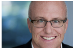
Encerra a maior organização cristã que se dedicava a 'curar' a homossexualidade