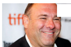
Morreu o ator James Gandolfini